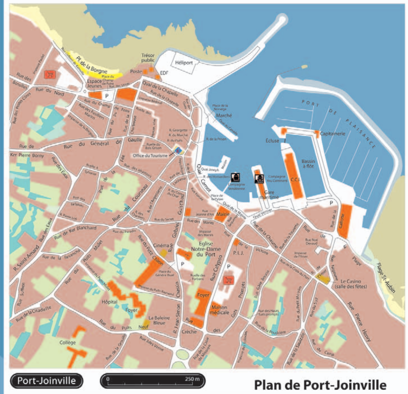
Plan de Port-Joinville